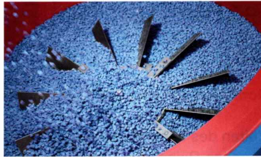
Bei den Tests des Multivibrators MV 50 für die Oberflächenbearbeitung von Blisks für Flugzeugtriebwerke wurde ein Dummy verwendet

Durchmesser von bis zu 1.300 mm vollautomatisch in einem Arbeitsgang. Er eignet sich zum Beispiel für Komponenten von Flugzeugtriebwerken und Windkraftanlagen, außerdem für Turbinenlaufräder oder Presswerkzeuge in Gesenkschmiedepressen. Die erste Anlage der neuen Baureihe wird Walther Trowal in Kürze an