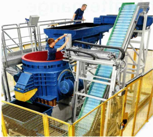
Der Arbeitsbehälter des neuen Multivibrators MV 50 für große Werkstücke hat einen Innendurchmesser von 1.600 mm

Durchmesser von bis zu 1.300 mm vollautomatisch in einem Arbeitsgang. Er eignet sich zum Beispiel für Komponenten von Flugzeugtriebwerken und Windkraftanlagen, außerdem für Turbinenlaufräder oder Presswerkzeuge in Gesenkschmiedepressen. Die erste Anlage der neuen Baureihe wird Walther Trowal in Kürze an