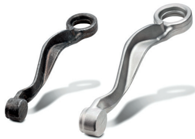
Vorher – nachher: Ein Achsschenkel für Pkw.

Wegen des geringeren spezifischen Gewichts ist der Impuls jedes einzelnen Strahlmittelkorns beim Aufprall auf die Werkstückoberfläche im Vergleich